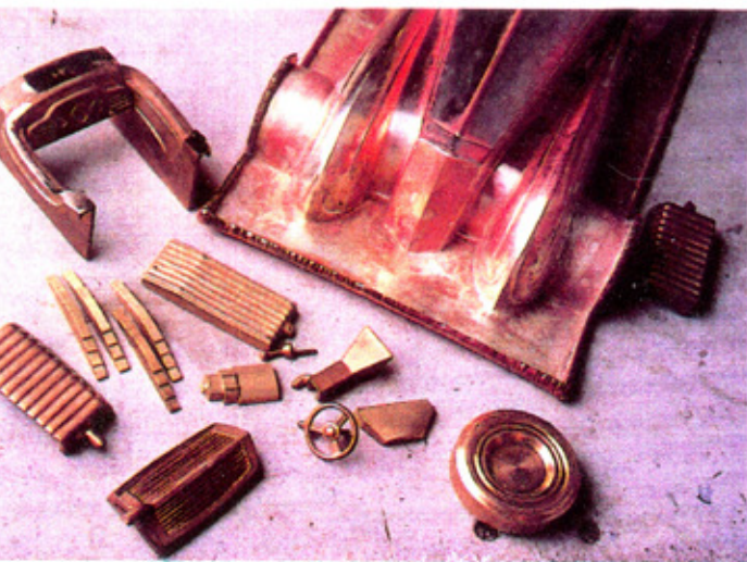
Mise en forme à la main d'un moule, autour de la sculpture en bois dur établie grâce à la mesure des gabarits.